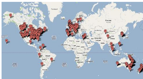
Access Grid Node Map 2010

Les chercheurs et les ingénieurs «connectés» dialoguent et interagissent, ils partagent des instruments scientifiques, conduisent des expériences, manipulent et visualisent des données à travers internet. Fin 2010 323 sites répartis dans 31 pays possèdent des installations spécifiques pour utiliser Access Grid et le groupe d'utilisateurs français créé au sein d' Aristote , rassemble INRA, CEA, IDRIS, École Polytechnique, IRCAM, Centre Pompidou, etc.